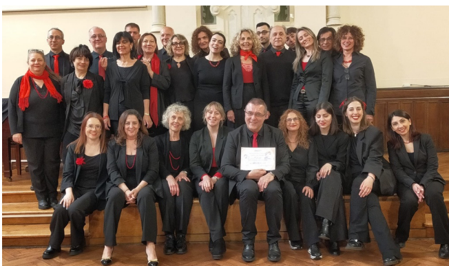
Coro Crypters aps